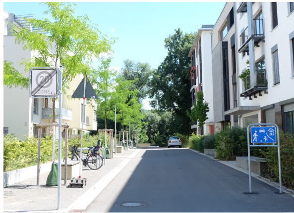
Tübingen - Alte Weberei