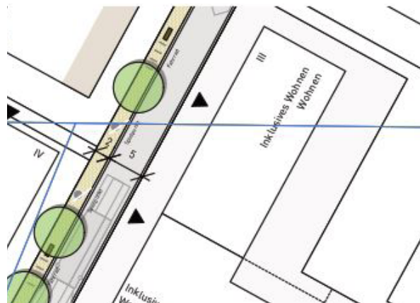
Sonnenhof - Entwurf Verkehrswege