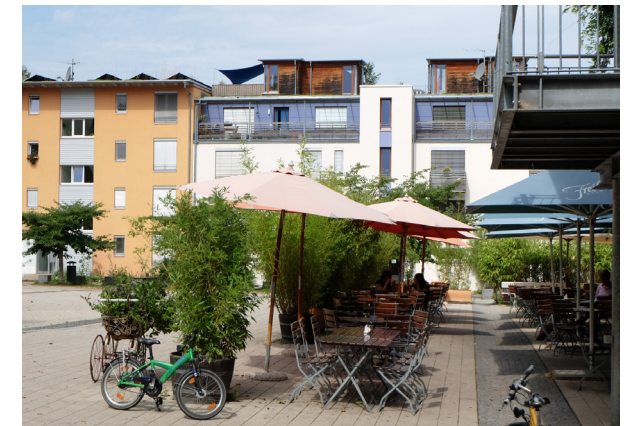
Freiburg - Vauban