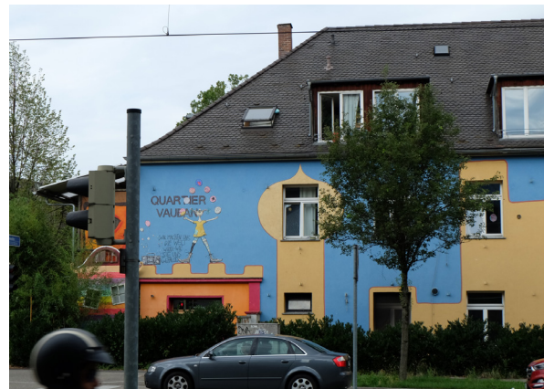
Freiburg - Vauban