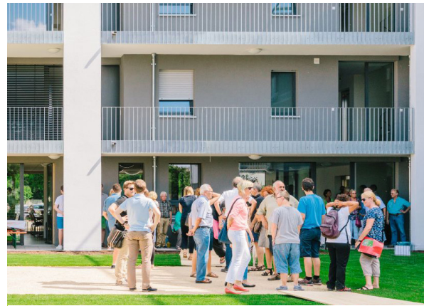
Metzingen - Sannental

Um eine ganzheitliche Koordination gewährleisten zu können, wurde unter anderem bei den Workshops die Idee eines Quartiersmanagements diskutiert. Dies könnte zum Beispiel eine Kombination aus zentraler Postannahmestelle / Wäscheservice / Anlaufstelle für Behördengänge / Angebote für Pflegedienste sein.