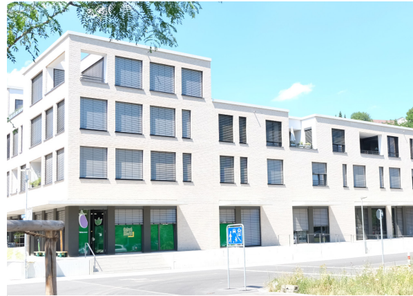
Tübingen - Alte Weberei